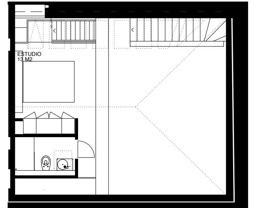
PLANTA BAJO CUBIERTA